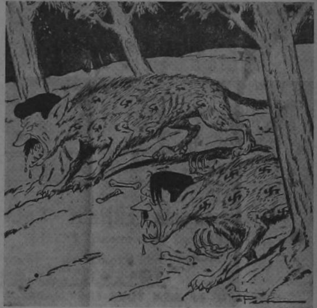
Una fiera se parece a otra