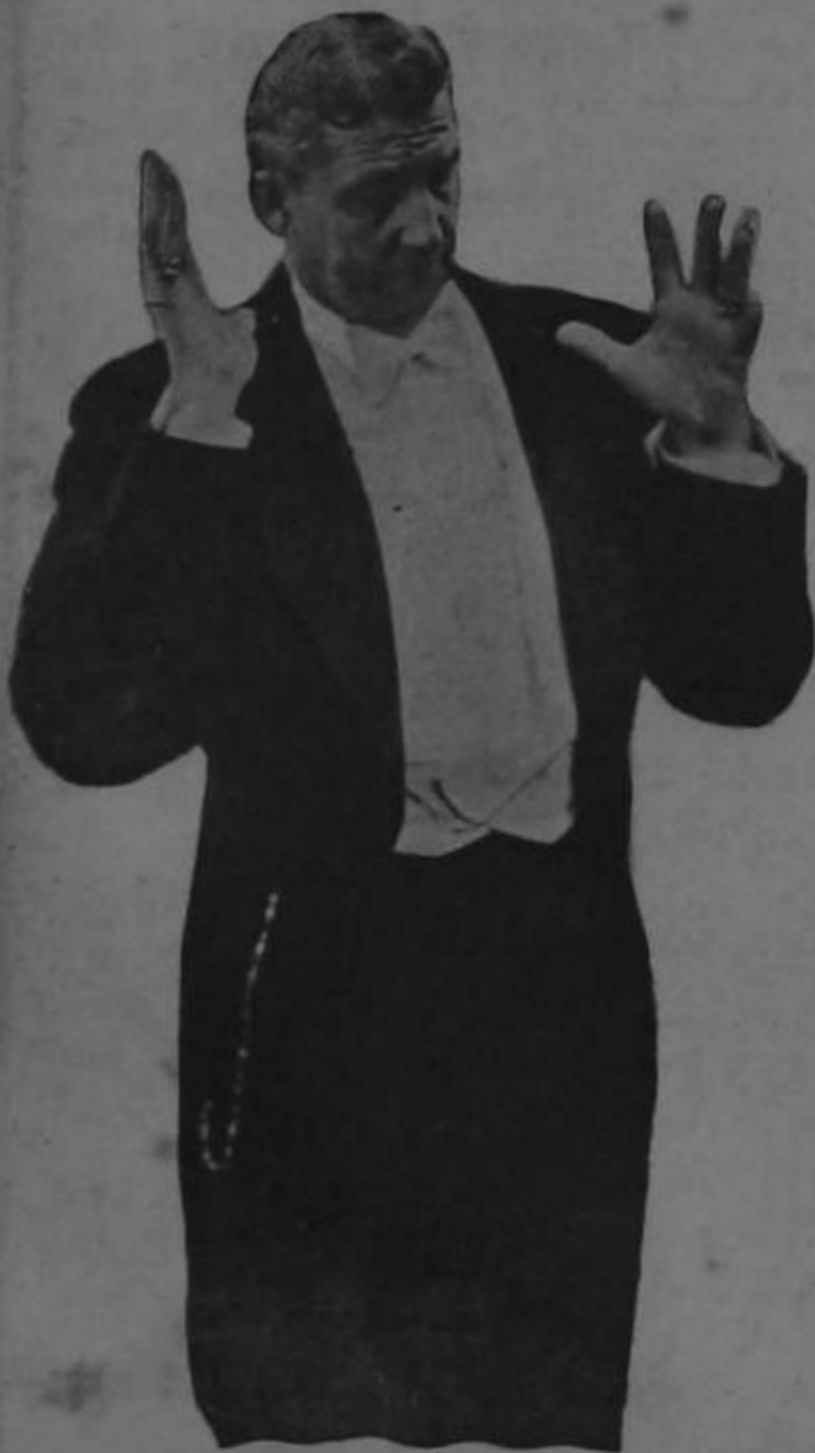
Lo mejor es que el que venga atrás, que arré

El país entero reclama que se resuelva pronto este importante problema.